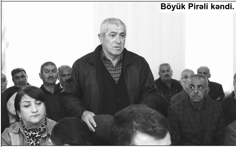
Böyük Pirəli kəndi.