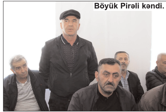
Böyük Pirəli kəndi.