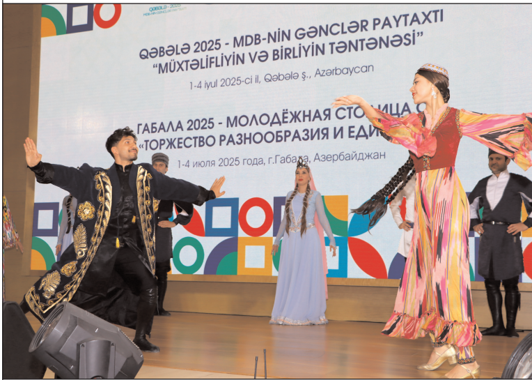
Azərbaycan Respublikası Gənclər və İdman Nazirliyinin və Qəbələ Rayon İcra Hakimiyyətinin birgə təşkilatçılığı ilə "Qəbələ - MDB-də Gənclər paytaxtı - 2025" beynəlxalq proqramının açılış mərasimi keçirilmişdir.