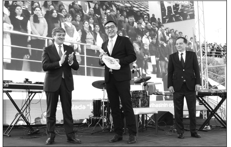
ları öncə Azərbaycan dövlətinin memarı və qurucusu Ulu Öndər Heydər Əliyevin və "Qarabağ