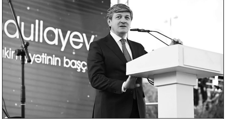
heyatına keçirilən "Qazax - İdman Paytaxtı 2026"-nın açılış mərasimi keçirilmişdir. Tədbir iştirakçıları Qazax şəhərində Azərbaycan Respublikası Gənclər və İdman Nazirliyinin layihəsi əsasında yon ictimaiyyəti adından dərin minnətdarlığını bildirmişdir. Gənclər və İdman naziri Fərid

Qazax şəhərində Azərbaycan Respublikası Gənclər və İdman Nazirliyinin layihəsi əsasında yon ictimaiyyəti adından dərin minnətdarlığını bildirmişdir. Gənclər və İdman naziri Fərid