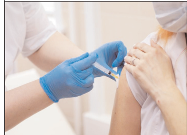
Koronavirus (COVID-19) infeksiyasının yayılmasının qarşısının

1908-ci il yanvarın 25-də Tağıyev teatrında Üzeyir Hacıbəyovun ilk operası olan "Leyli və Məcnun"-un ilk tamaşası olmuşdur. Azərbaycan mədəniyyətinin daxilində yaranan bu opera Azərbaycan musiqisində opera janrının formalaşması və təşəkkül tapmasının başlanğıcı idi.